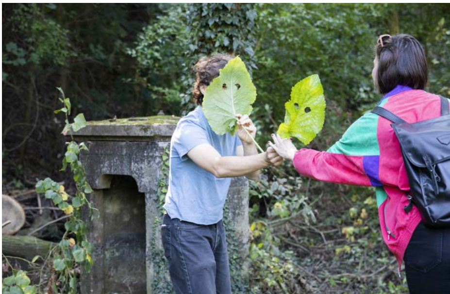
Zakouzlení v krajině Petra Stranensis můžete zažít 13. 10. na úpatí Stránské skály