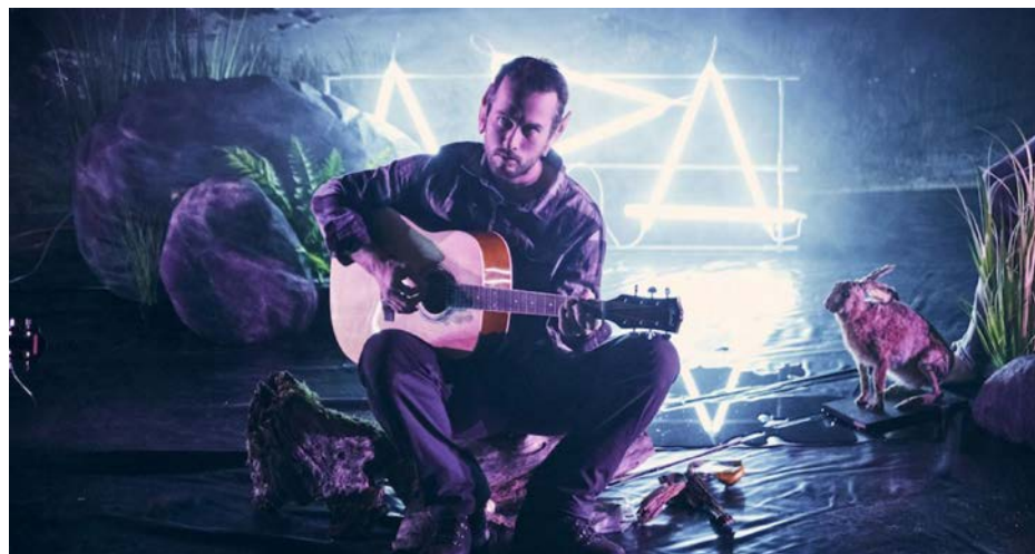
Divadelní báseň Krajina s bažantem, zajícem a srnkou festival uvede 13. 10. v HaDivadle

Festival ...příští vlna/next wave... obdržel v únoru 2024 Cenu Česká divadelní DNA za mimořádný dlouhodobý přínos, rozvoj a podporu nového divadla a živé kultury.