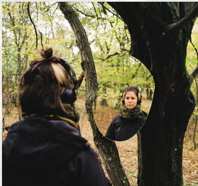
Unkulunkulu – escapescape . FOTO ARCHIV

19.30 Jan Mocek: Krajina s bažantem, zajícem a srnkou