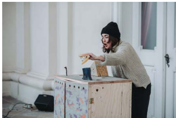
Pohádku pro diváky od 4 let Neboj, Houbo uvádíme 21. 9. v divadle Komédie a 12. 10. v HøDivadle.