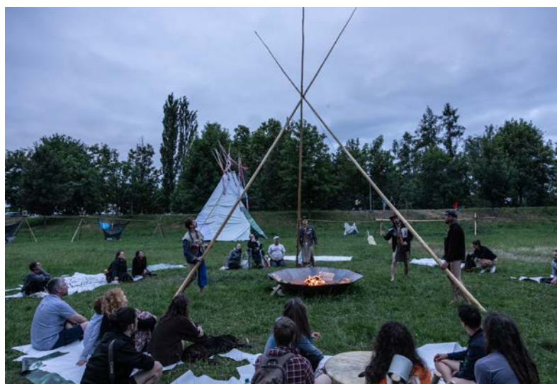
Projekt ve čtyřech týpích K Prameni uvádíme od pondělí 16. 9. do středy 18. 9. na ostrově Štvanice.