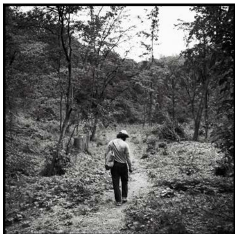
Performativní výlet Valle Silentium a Petra Stranensis můžete zakusit v Praze 22. 9. a v Brně 13. 10.