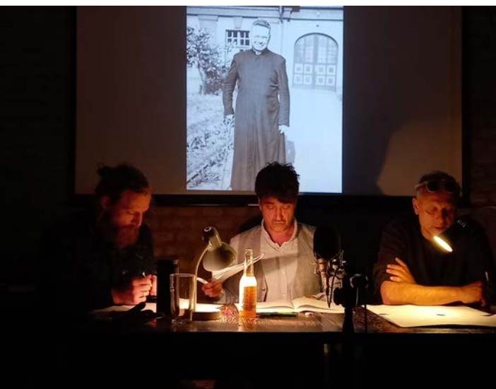
Snímek ze zkoušení.

Dnešní lidé se toulají přírodou a tvrdí, že mají velké porozumění pro přírodu. Když za jarních dnů leží na louce nebo na úpatí hory a vyhřívají se na sluníčku sní, nerozumí proto ještě přírodě. Když za půl dne projdou dvě nebo tři luční cesty a svým jazýčkem při tom žvatlají jako bublající luční potůček, nerozumí proto ještě přírodě. Když se toulají po světlých slunných stezkách nebo ve stínu lesa a obdivují bělost, červeň a modř květů a všechnu tuto krásu halí v písně a poezii, nerozumí proto ještě přírodě. Když časné zrána vystupují na hory, aby tam pozdravili první paprsky sluneční, nerozumí proto ještě přírodě. Když poslední žár večerního slunce srovnávají s polibkem dobré noci, nerozumí proto ještě přírodě. Když za zimních dnů jako sportovci se prohánějí po zasněženém kraji a v létě si hrají na pestrých lučinách s motýly, nerozumí proto ještě přírodě. Přírodu pochopil v celé její hloubce jen ten, kdo vidí, jak spíná ruce, Boha uznává za svého stvořitele a modlí se. Zrna na polích, květy na nivách, zpěv ptactva, svit blesku, rachot hromu, skučení větru, burácení bouře, hučení moře, světlo slunce, záře hvězd – to vše je modlitba, ovšem nevědomá modlitba, modlitba beze slov, neboť to vše se poslušně sklání před vůlí Boží. (L. A. Hlad)