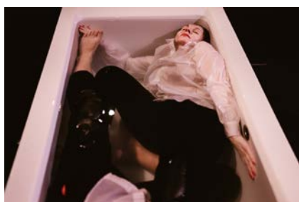
Divadelní esej ve vaně Ti druzí bude uveden v divadle Komédie 20. 9.