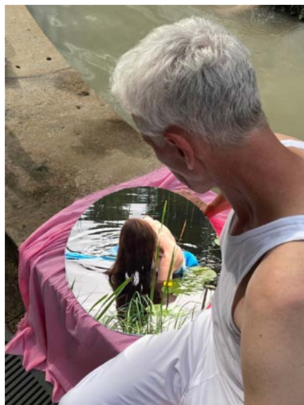
Performance Nymfa a patriarcha se bude odehrávat u štvanických lázní Baden Baden.