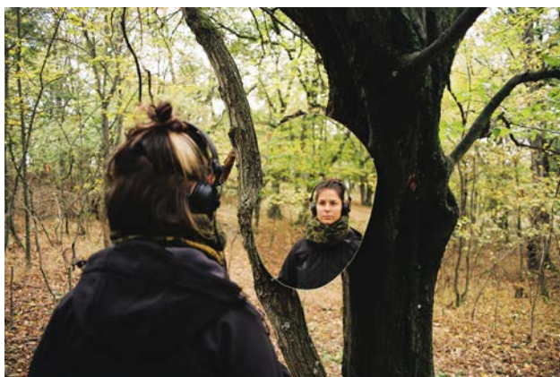
Performativní procházky escapescape se budete moci zúčastnit od pondělí 23. 9. do středy 25. 9.