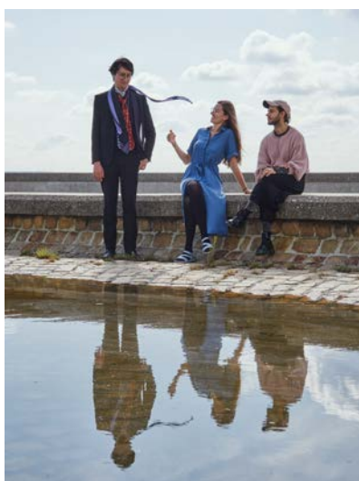
Trio Pudlax uslyšíte 20. 9. v divadle Komédie.