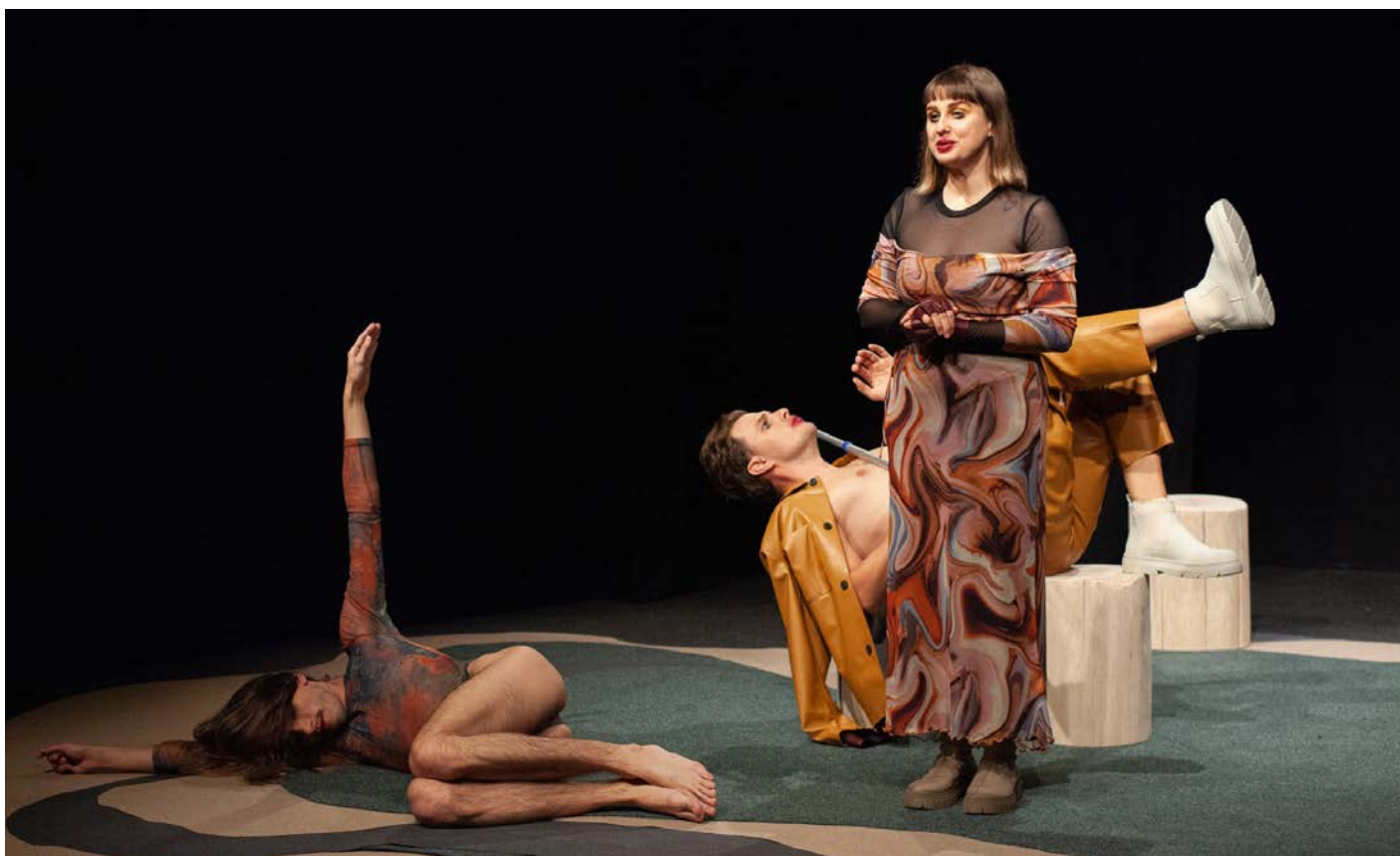
Endokanabinoid zakončí pražskou část festivalu, představení bude uvedeno 26. 9. v divadle Alfred ve dvoře.

LENKA: Ja si to predstavujem asi ako spálené vlasy.