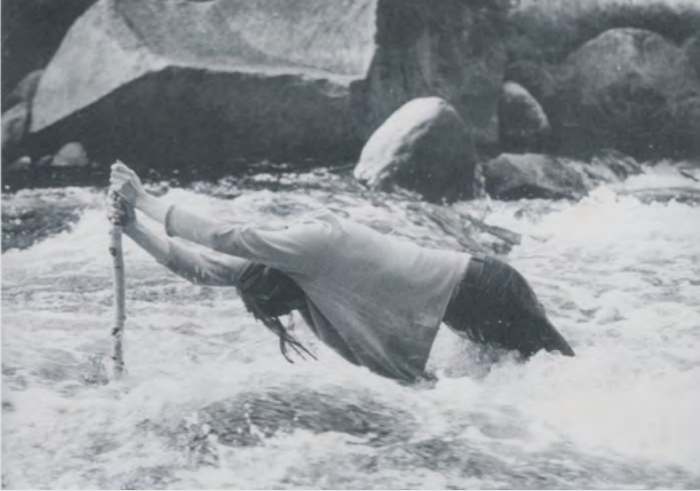
Socha (Kontakt V), Šumava, 1980

V létě 1980 jsem uskutečnil několik jednoduchých akcí na šumavské řece Vydrě a na Hamerském potoce. Tyto akce navazovaly na předchozí tělesné kontakty s kameny a ohněm. Fascinovala mě dravá prudkost říčního proudu, celková krajinná scenerie a myšlenka „skulpturálního sebezačlenění“ do této krajiny, jejíž plynoucí /a zvukovou/ páteří byla řeka. Jednalo se mně o upřesnění poměru mezi tělesnou dynamikou a dynamikou prudkého říčního živlu, o bezprostřední zkušenost v navozené situaci a o jakýsi způsob sebetestace. Snažil jsem se o to, násilně nepřekračovat určitý fyzický /i psychický/ limit, aby nedošlo k rozbití přirozeného kontaktu a k nicneřikající destrukci.