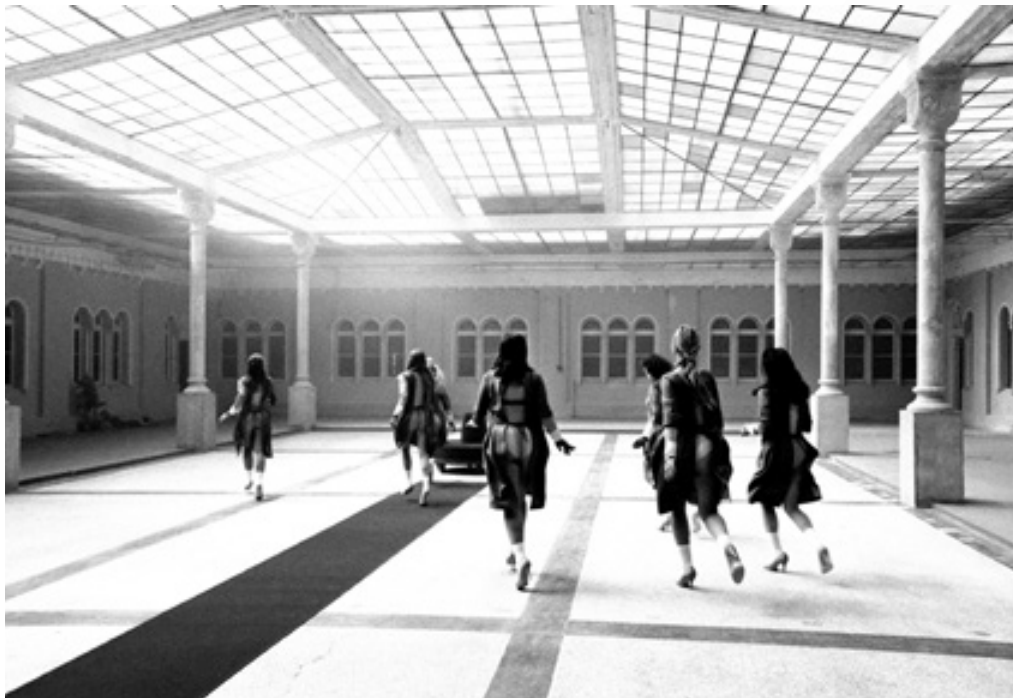
Depresivní děti touží po penězích: Happy end v hotelu Chateau Switzerland