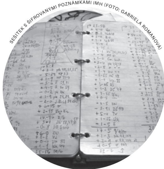
SEŠITEK S ŠIFROVANÝMI POZNÁMKAMI IMH

s iniciálami „EE“ na hřbetě, někdy i na přední straně desek. Ty byly obaleny zpočátku do černého plátna, později do plátna barvy světle pískové. Podle barev se knížky vydané v Edici Expedice později začaly rozdělovat na černou a světlou řadu. Všechny ovšem měly v tiráži shodnou stejnou větu, která hlásala, že „Pro sebe a své přátele opsál VÁCLAV HAVEL“ — s vlastnoručním podpisem. Je pravda, že budoucí prezident ve skutečnosti stěží na psacím stroji přefukal byt' jedinou knihu, nicméně přesto měla tahle věta svoje opodstatnění — měla v případě zabavení státní bezpečností ochránit skutečné pisárky a pisáře. A zároveň taky sloužila coby ochrana před nařčením z porušování autorských práv, neboť platilo, že téměř veškeré samizdatové texty, tedy nejen ty expediční, byly vydávány tajně a bez domluvy s autory. Těm samozřejmě ani nepříslušel povětšinou žádný honorář. Jediný, kdo za svou práci pro samizdatová „nakladatelství“, Expedici nevyjímaje, dostával zapláceno, byli ti, kdo texty v několika kopiích (povětšinou 10—16) opisovali a vázali. Pisárkám se většinou platilo 5 Kčs za jednu opsanou stránku, což byly na tehdejší dobu poměrně slušné peníze — stála tolik například půlka chleba, takže za celou opsanou stostránkovou knížku mohla být pisárka dobře živa.