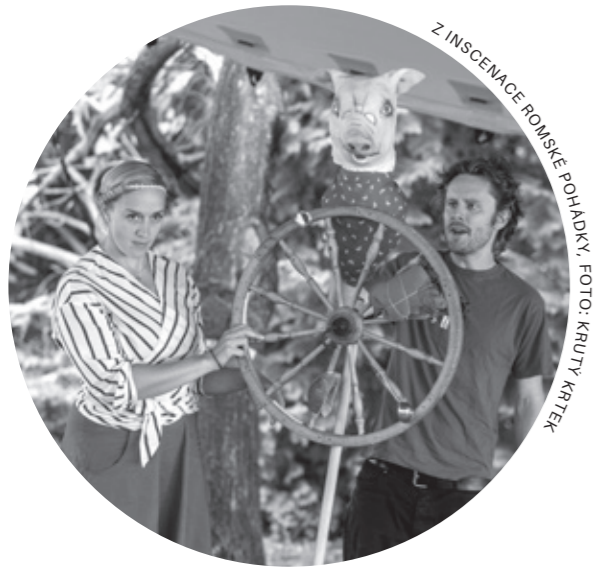
Z INSCENACE ROMSKÉ PŮHÁDKY