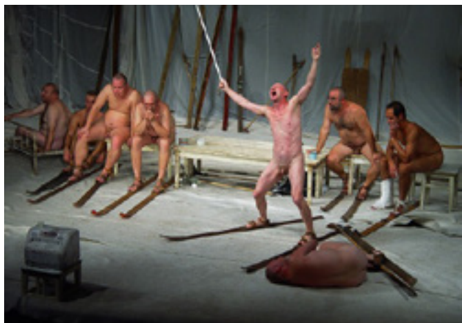
Ty, který lyžuješ

V loňském roce jsme uvedli na festivalu v Maďarsku inscenaci Zde – na ostrém rozhraní života (POSTELE) a při té pří-