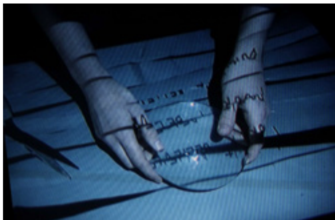
The Stranger Gets a Gift Service

Umělkyně, z rozličných oborů, vytvořily tři na sobě nezávislé (ale souběžně probíhající) performance/instalace – Amuleto, Interruptor a Reminiscencia, které Uživatel může na vlastní kůži zakusit.