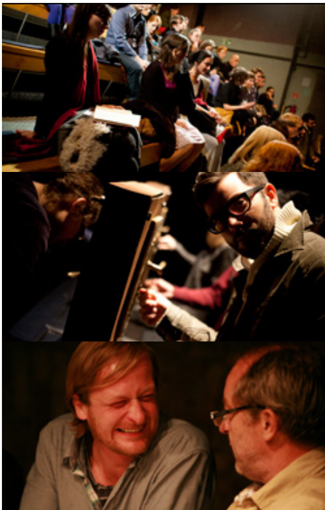
The Stranger Gets a Gift Service

tiku nezměnil. Proč by to také dělal, když proti jeho moci neexistuje páka – tedy kromě existenční závislosti na vodě. Příjmy z prodeje ropy vyschlé studny nenaplní, maximálně jimi můžete zacpat ústa lidu nebo zástupci mezinárodní organizace na ochranu lidských práv Bruno Koníčkoví z demokratické, leč mocensky zcela bezvýznamné České republiky. Ale bez vody nepřežije ani diktátor. Řešení? Vyvraždit část lidstva. Na nějakou dobu bude dost vody pro všechny. A v zubožené zemi není rozpoutání válečného konfliktu zase takový problém. Bída dělá z lidí zvířata a boj proti terorismu platí za mezinárodně uznávaný důvod.