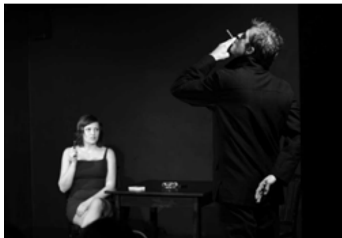
Divadlo Kámen: Karkulka, Agamemnón a křest knihy

Agamemnón je jemně strukturovaná improvizace vycházející z četby krátkých úseků z právě křtěné knihy o dosavadní patnáctileté historii Divadla Kámen, založená na nové improvizáční formě připravované pro podzimní premiéru inscenace Agamemnón.