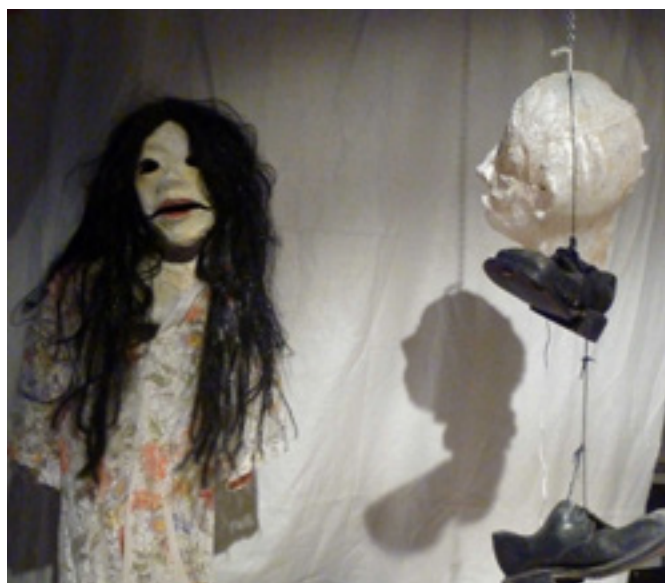
Divadlo Mimotaurus: Sedmého dne

Umělkyně, z rozličných oborů, vytvořily tři na sobě nezávislé (ale souběžně probíhající) performance/instalace – Amuleto, Interruptor a Reminiscencia, které Uživatel může na vlastní kůži zakusit.