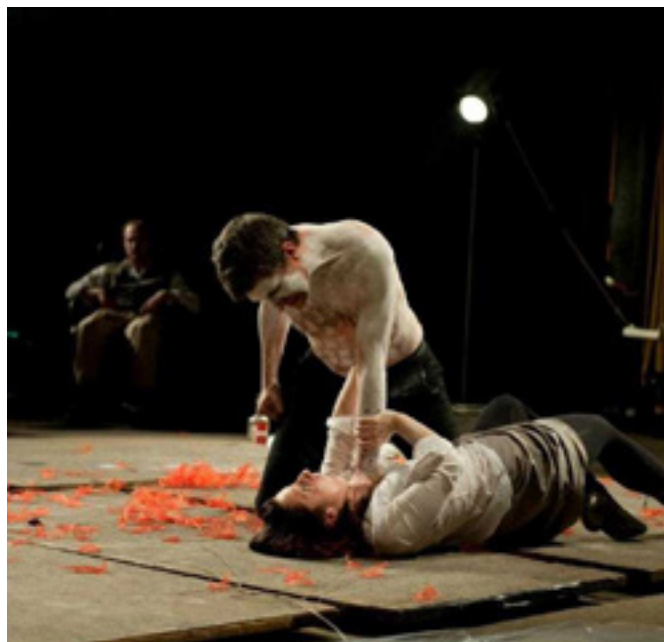
Divadlo Gasparego – M. B. Koltés: Boj černocho se psami

Speciálně pro festival připravené vystoupení kombinující žánry koncertu a divadelní performance. Audiovizuální projekt sdružení SPAM si jako materiál bere skladby z několika posledních Vladimírových desek, rozkládá je a následně znovu skládá do nového tvaru. Tímto procesem tak tes-